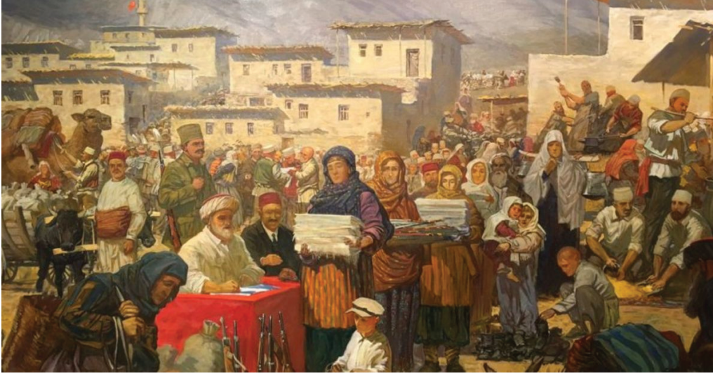
Tekalif-i Emirleri Doğrultusunda Türk halkının orduya malzeme götürüşünü gösteren tablo

Görsele göre Türk halkının aşağıdaki anlayışlardan hangisine sahip olduğu söylenemez ?